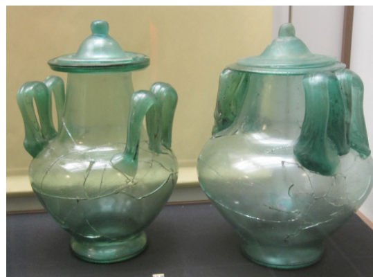
römische Graburnen (Mausacker)