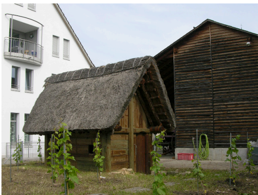
Grubenhaus, frühes Mittelalter