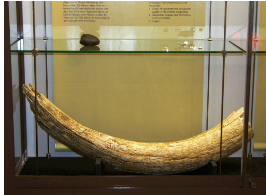
Mammutzahn 40'000 Jahre alt