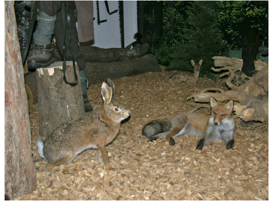
Feldhase und Fuchs