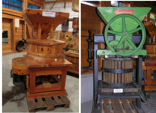
Getreidemühle und Obstpresse