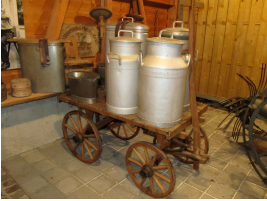
Leiterwagen mit Milchdansen