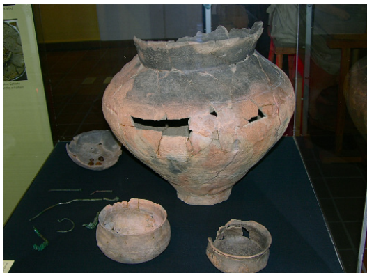
Brandurne 3'200 Jahre alt