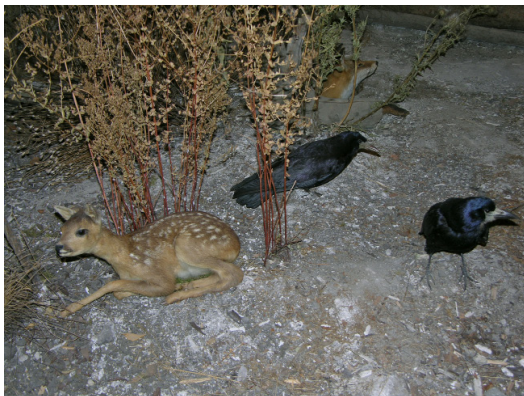
Reh und Krähen