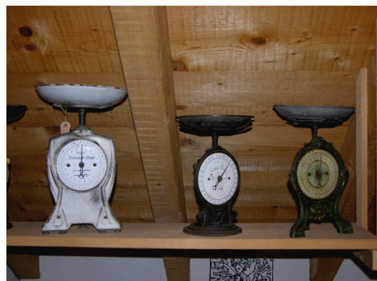
Messen und Wägen