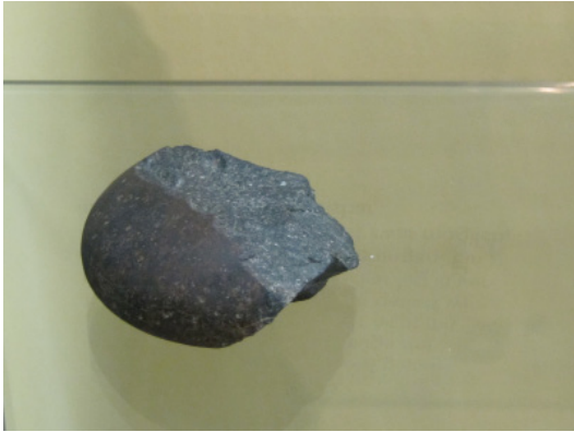
Geröllstein 500'000 Jahre alt?